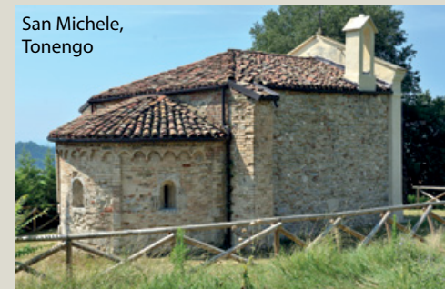
San Michele, Tonengo