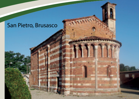
San Pietro, Brusasco