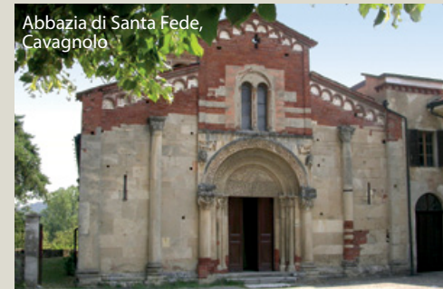
Abbazia di Santa Fede, Cavagnolo