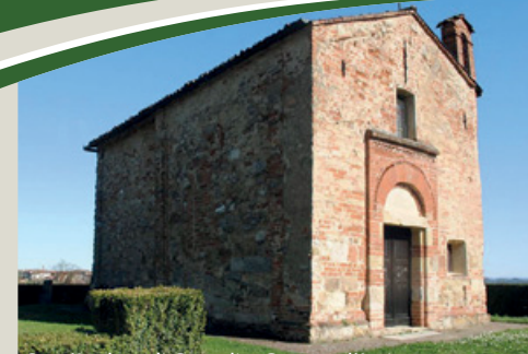
Sant'Andrea di Casaglio, Cerreto d'Asti