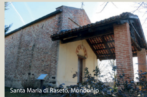
Santa Maria di Raseto, Mondonio