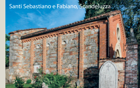
Santi Sebastiano e Fabiano, Scandeluzza