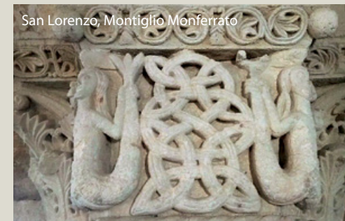
San Lorenzo, Montiglio Monferrato