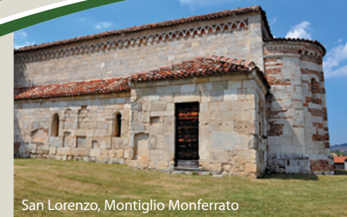
San Lorenzo, Montiglio Monferrato