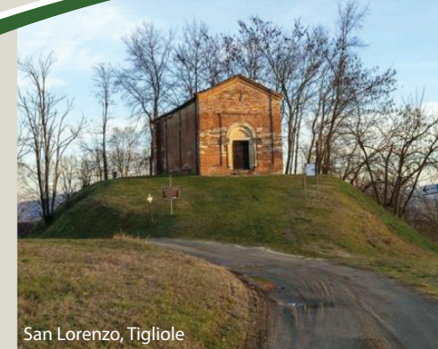
San Lorenzo, Tigliole