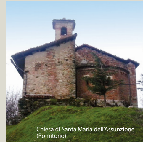
Chiesa di Santa Maria dell'Assunzione (Romitorio)